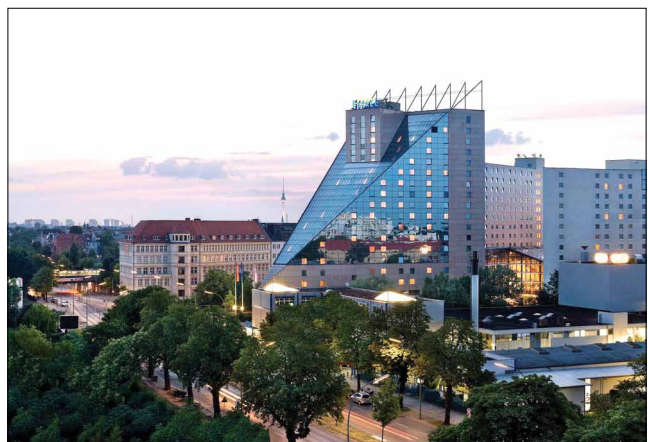
Место встречи – берлинский Estrel Hotel

Отдельного упоминания со сцены удостоились еще два недавних приобретения Siemens . Покупка в августе компании TASS International позволила дополнить предложение Siemens для автомобильно-строительной отрасли средствами создания бортовых систем (встроенных систем безопасности, продвинутых систем помощи водителю и беспилотного управления). По данным портала Business Insider , уже к 2021 году производить беспилотные машины будут 19 автоконцернов. Второе приобретение – компания Infolytica , чьи решения для