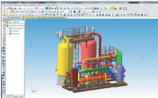
Модульная установка осушения газов. Корпорация “Уралтехнострой” (г. Уфа)

NVIDIA GRID на сегодняшний день является единственной технологией, позволяющей распределить общие ресурсы графического процессора между несколькими виртуальными рабочими столами без ущерба для графической производительности. При поддержке компании NVIDIA мы провели всестороннее тестирование совместимости КОМПАС-3D V15 и технологии виртуализации NVIDIA GRID. В ходе тестирования особое внимание было уделено удобству взаимодействия пользователя с виртуальным рабочим окном КОМПАС-3D V15, качеству отрисовки и производительности всей системы при различных условиях и нагрузках. Проведенные нами работы показали, что виртуальное рабочее место по удобству ничем не уступает стационарному компьютеру, а производительность КОМПАС-3D V15 в инфраструктуре NVIDIA GRID сравнима с производительностью 3D-САПР на стационарной рабочей станции”.