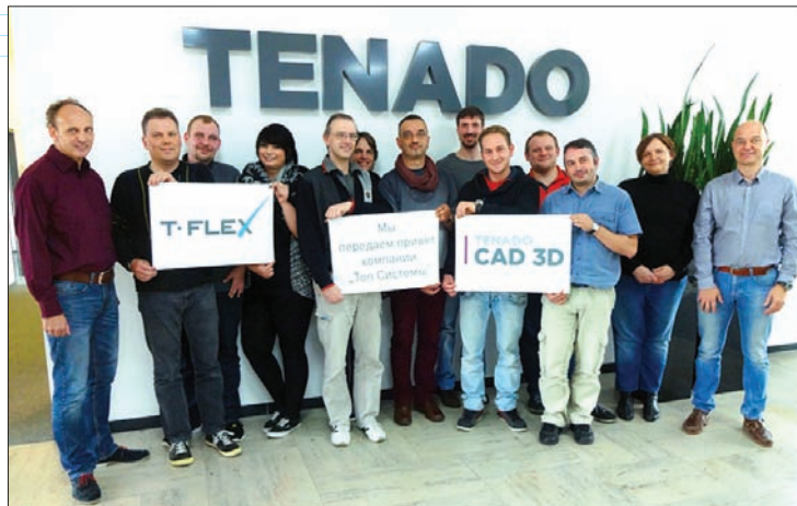
Команда TENADO объявила о сотрудничестве с компанией "Топ Системы"

На деле ситуация выглядит вот как. Российская компания "Топ Системы", известный производитель программного обеспечения под торговой маркой T-FLEX, и немецкая компания TENADO, уже порядка 30-ти лет специализирующаяся на разработке и внедрении САПР в области строительства, архитектуры, противопожарной охраны, машиностроения и ландшафтного дизайна, заключили