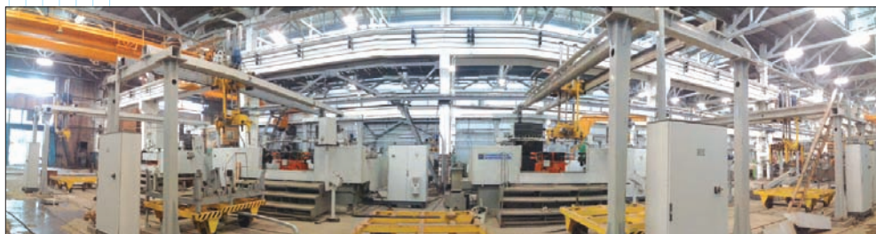
Автоматизированная производственная линия компании “СТАНЭКСИМ”

• CRM – классическая по своей организации и методологии система управления взаимоотношения с