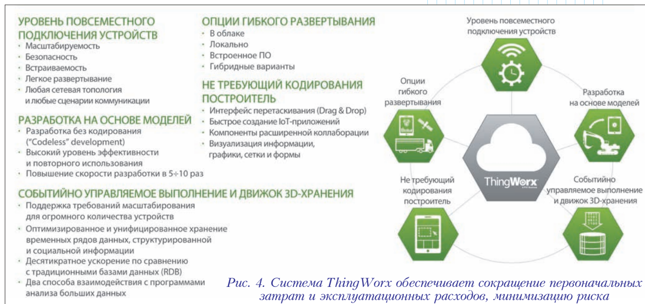
Рис. 4. Система ThingWorx обеспечивает сокращение первоначальных затрат и эксплуатационных расходов, минимизацию риска

Многие объекты создаются мобильными – к примеру, хирургические насосы могут перемещаться вместе