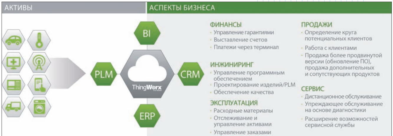
Рис. 1. Улучшение бизнес-процессов с помощью информации от умных, сетевых изделий

Числовые показатели ( Metrics ) – это количественная мера качества, история успеха, которая содержит измеряемые в цифрах преимущества. Они могут характеризовать следующее: уменьшение времени выхода на рынок, повышение производительности, увеличение рыночной доли, уменьшение затрат, большую рентабельность в целом – любой результат в виде экономии или