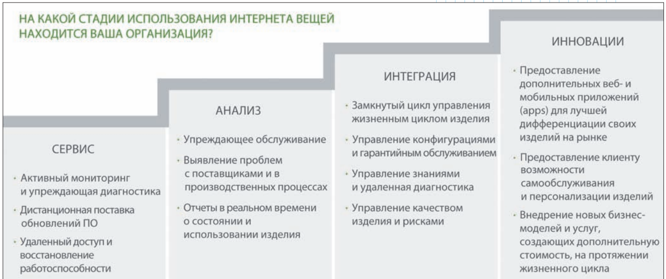
Рис. 2. Модель зрелости предприятия в отношении использования возможностей изделий