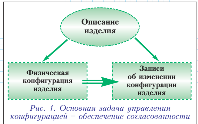
Рис. 1. Основная задача управления конфигурацией – обеспечение согласованности

Но, как показывает практика, обеспечить согласованность легче на словах, чем на деле. Для любого сложного изделия, содержащего десятки, а то и сотни тысяч объектов конфигурации, задача отслеживать состояние каждого из них (а тем более,