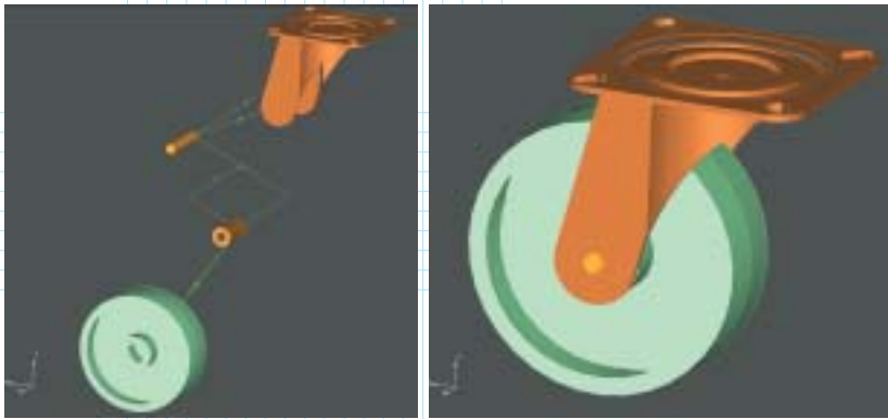
Рис. 2. Сборочная модель колеса с цилиндрическими деталями

геометрических ограничений. В результате автоматического добавления ограничений модель становится полностью определенной и параметрической. Это означает, например, что для изменения ширины проема теперь достаточно изменить лишь параметр ограничения расстояния. Логика чертежа при этом будет полностью сохранена.