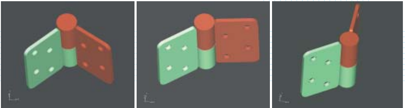
Рис. 3. Динамический пересчет модели шарнира при вращении одной из его частей

гарантирует не только оперативную реакцию на все обращения, но и то, что ответы будут персональными и неформальными. Система IMS используется как самими разработчиками компании, так и рядом её крупных зарубежных заказчиков, а потому является наиболее оперативным и надежным средством для решения обнаруженных проблем.