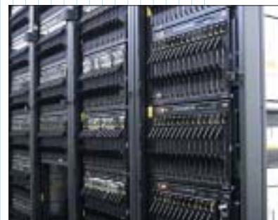
Рис. 6. Входящий в международный рейтинг TOP500 кластер MBC-15000BM является лидером российского TOP50

мает кластер MBC-15000BM (рис. 6). Впервые система появилась в 25-м списке TOP500