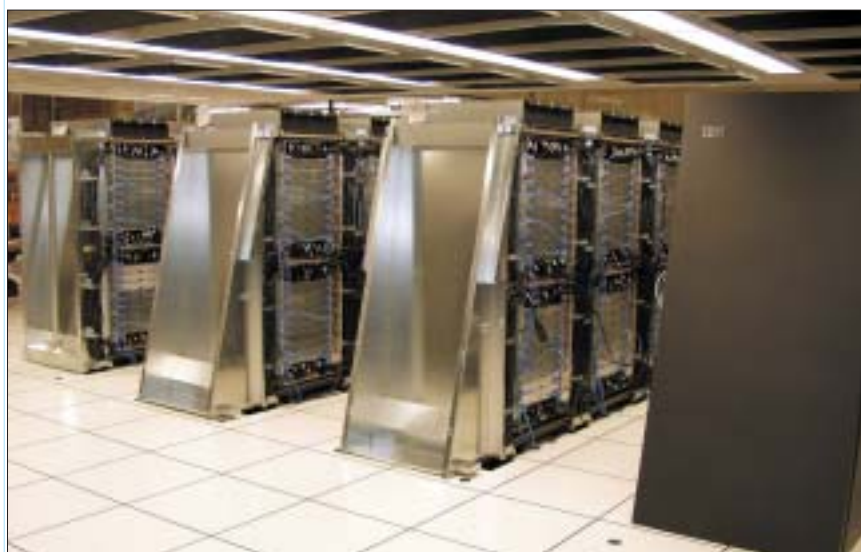
Рис. 3. Blue Gene/L – самый мощный компьютер в мире

✓ Производительность суперкомпьютеров непрерывно растет. Общая производительность систем, представленных в TOP500 за ноябрь 2005 года, достигла 2.30 PFLOPS (1 PFLOPS = 10^{15} FLOPS ), что в 2.04 раза больше, чем было год назад. Растет и “проходной балл” для попадания в TOP500 – для нынешнего 26-го списка он составил 1.646 TFLOPS , а чтобы занять первую сотню мест требовалось выполнять не менее 3.98 TFLOPS .