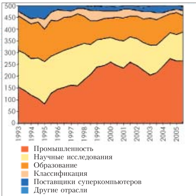
Рис. 4. Отрасли, являющиеся потребителями суперкомпьютерных систем (1993÷2005 гг.)

✓ Наиболее распространенными являются компьютеры со следующим количеством процессоров: 513÷1024 (50.2% систем), 257÷512 (25.4%) и 1025÷2048 (13.4%). В 333 суперкомпьютерах из 500 установлены процессоры Intel (в том числе, на Intel EM64T базируется 81 система, а на Intel Itanium 2 – 46 систем). Кристаллы IBM Power послужили основой для 73 систем. На базе AMD Opteron построено 55 систем, из которых пять – на двухъядерных.