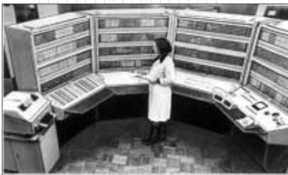
Рис. 1. БЭСМ-6

Однако, если копнуть поглубже, то выясняется, что логика развития автоматизированного проектирования заставляет нас по-новому взглянуть на аппаратные средства, необходимые сегодня для разработки всё усложняющихся изделий. За последнее