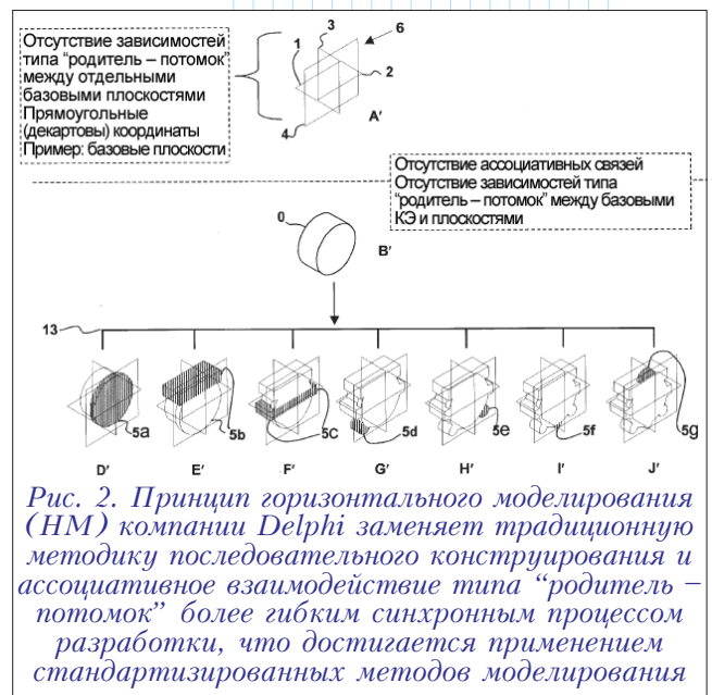
Рис. 2. Принцип горизонтального моделирования (HM) компании Delphi заменяет традиционную методику последовательного конструирования и ассоциативное взаимодействие типа “родитель – потомок” более гибким синхронным процессом разработки, что достигается применением стандартизированных методов моделирования

В официальном документе “ Horizontal Modeling & Digital Process Design ” ( delphi.com/pdf/dti/dcce/whitepaper_sept19.pdf ) компании Delphi Technologies подробно изложены преимущества, которые предоставляет разработанный подход. После его внедрения г-н Marseilles и другие разработчики процессов отметили 50%-сокращение времени на создание (или воссоздание) CAD -моделей, а также 90%-сокращение времени при внесении изменений.