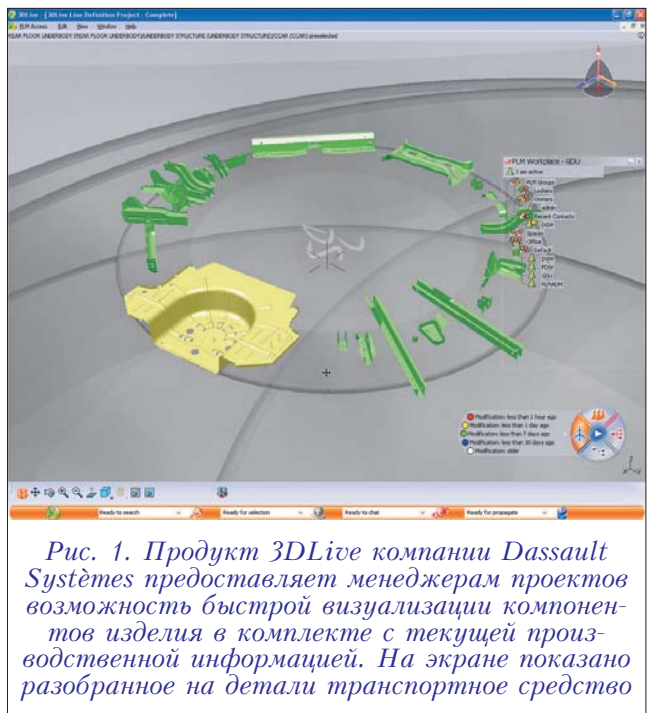
Рис. 1. Продукт 3DLive компании Dassault Systèmes предоставляет менеджерам проектов возможность быстрой визуализации компонентов изделия в комплекте с текущей производственной информацией. На экране показано разобранное на детали транспортное средство

Продукт 3DLive (рис. 1), представляющий собой 3D PLM -среду для навигации по репозитарию PLM -системы, предлагает, помимо других возможностей, “единый иммерсивный (то есть, обеспечивающий полный эффект присутствия. – Прим. ред. ) интерфейс, объединяющий разработчиков, процессы и изделия, что необходимо для ускорения принятия решений и продвижения инноваций”.