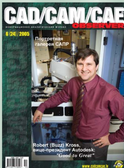
Robert (Buzz) Kross, вице-президент Autodesk: "От хорошего к лучшему"