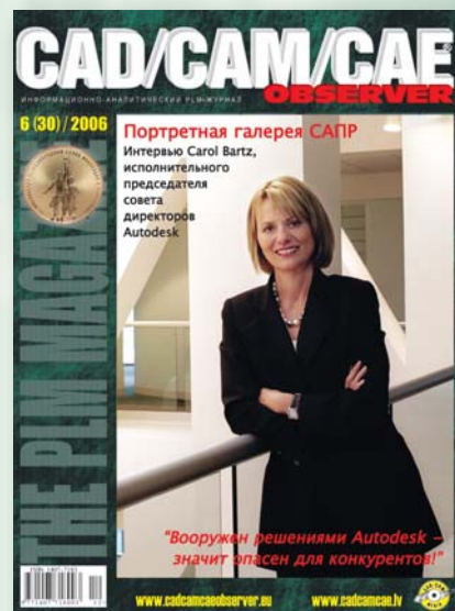
Carol Bartz, исполнительный председатель совета директоров Autodesk: "Вооружен решениями Autodesk – значит опасен для конкурентов!"