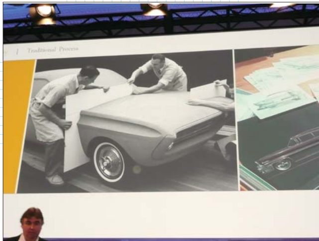
Когда-то прототипы автомобилей Ford изготавливались из глины

работой существенно быстрее. В условиях глобализации, когда дизайнерские студии находятся в Америке, Китае, Австралии и Европе, приходится решать ряд проблем. Для передачи информации требуются цифровые инструменты. Дизайнерские студии компании Ford теперь полностью цифровые, что позволяет оптимизировать документооборот и процесс разработки дизайна автомобиля. «Значительная доля нашего успеха приходится на применяемые нами цифровые инструменты», — подчеркнул г-н Horbury. — «Я могу с гордостью сообщить, что срок вывода изделия на рынок с использованием этих инструментов сократился у нас на 14 месяцев в сравнении с этим показателем четыре года назад».