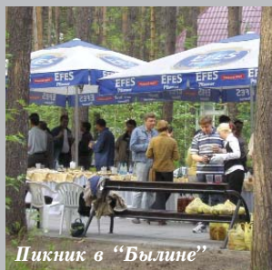
Пикник в "Былине"