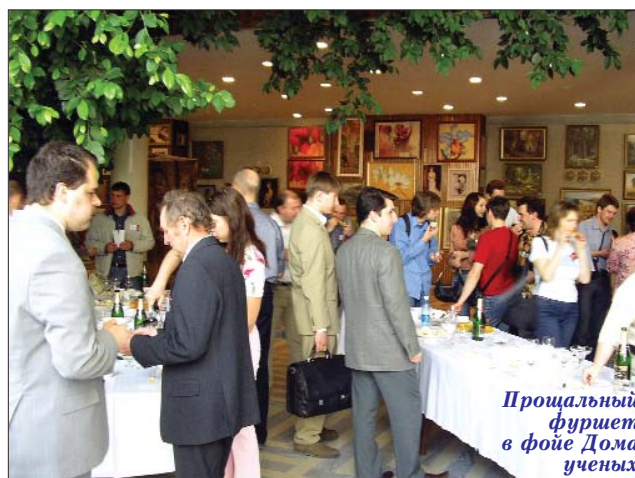
Процальный фуршет в фойе Дома ученых

полезно узнать, что оргкомитет isicad-2006 продолжает свою трудовую вахту, результаты которой отражает домашняя страница http://isicad.ru/ru/2006 , а также http://isicad.ru/ru . Уже подготовлен CD, включающий все поступившие от докладчиков презентации (в виде PPT ), фотографии, профессиональный 10-минутный видеоролик о форуме, плюс