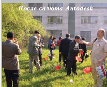
После салюта Autodesk

ИТ-мероприятий. В целом форумов по тематике САПР ( PLM, ERP, etc. ) в мире, да и в России проводится немало, но они, большей частью, в чём-то напоминают бенефисы: компания-разработчик, её партнеры и клиенты говорят добрые слова о продуктах этого самого разработчика... Безусловно, эти форумы необходимы и полезны – об этом мы не раз уже писали, всячески агитируя инженеров и ИТ-специалистов участвовать в мероприятиях такого рода. Гораздо реже удастся собрать представителей нескольких конкурирующих фирм под одной крышей, и уж, тем более, за одним столом. Этим не могут похвастаться даже крупные выставки – при всём уважении к их масштабам нельзя не отметить, что там царит совсем другой, куда более коммерческий и официальный дух. Конечно, общение в кулуарах имеет место быть на всех мероприятиях, но оказаться в кругу представителей компаний-конкурентов, не спеша потягивающих пиво и обсуждающих, скажем так, неочевидные аспекты автоматизации, вам вряд ли удастся... Не будем забывать и о том, что ИТ-выставки и форумы, обычные для столиц, для жителей Сибирского региона привычны гораздо меньше.